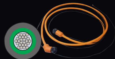
Glenair PowerLoad™・PowerTrip™コネクタ用 TurboFlex®ケーブル