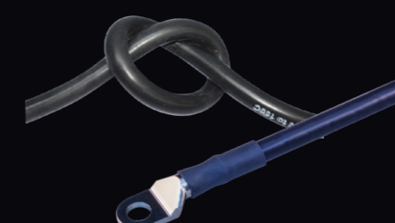
グラウンド接続としても最適