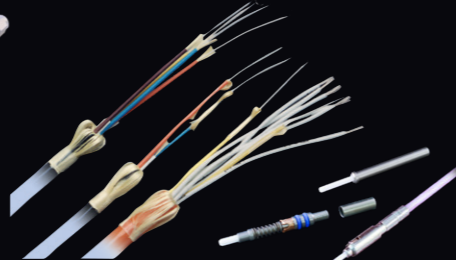
シングルモード・マルチモード 光ファイバーケーブル