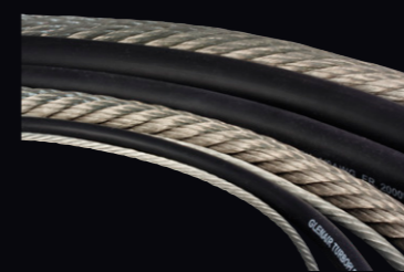
より線構造TurboFlex® 被覆付き/無し