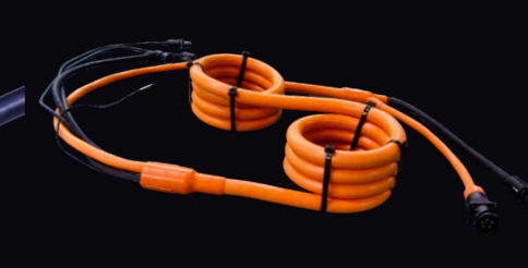
パイロン向けTurboFlex® ケーブルハーネス