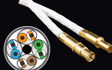
SpeedLine 航空宇宙グレード Glenair El Ochito™ コンタクト 10G Ethernet適合ケーブル

turboflex THE ULTRA FLEXIBLE RUGGED POWER CABLE ターボフレックス