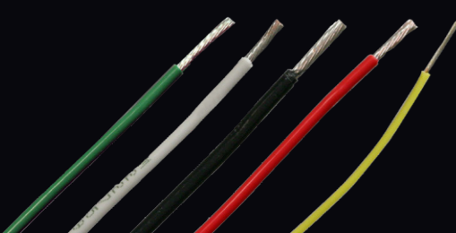
M22759 フックアップワイヤ 小ロット・短納期対応